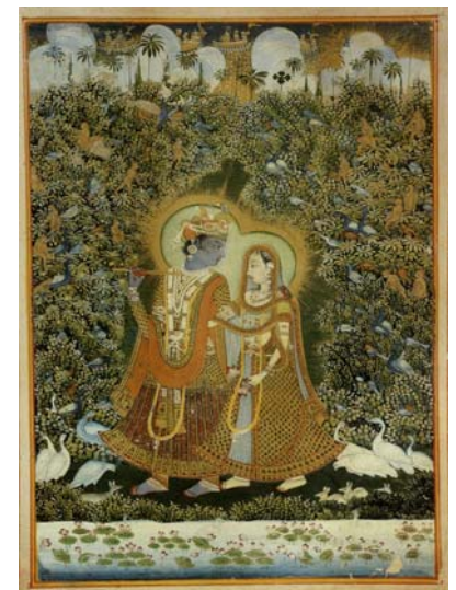
Fig. 4. Guazzo di carta del 1810 ca. raffigurante Krishna e Radha.

20. As.Ind.1.009a-b.Br. Portale a due ante raffigurante la giovane Radha e Krishna, manifestazione terrena del dio Vishnu. L'amore fra i due rappresenta la tensione dell'anima del devoto verso il divino. Eurasia. Regione indiana. India nord-occidentale. Gujarat. Circa XVIII sec. Legno, pigmenti e metallo.