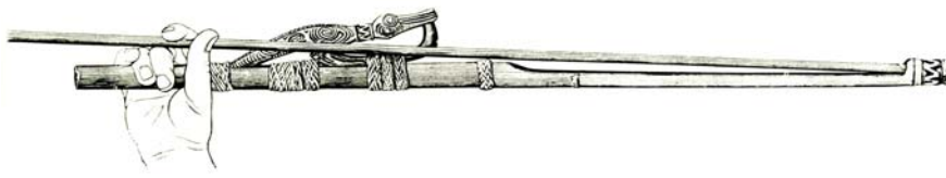
Fig. 9. Propulsore per scagliare dardi a grande velocità.

21. Oc.Mel.1.229.Br. Propulsore per dardi, col manico scolpito nelle forme di un muso di coccodrillo e il sostegno configurato nel volto di un lucanide, insetto che si trova in numerose espressioni di sintesi formale delle opere del Medio Sepik. Si tratta di un oggetto di distinzione e di un'arma da caccia e da guerra che serviva a scagliare dardi a grande velocità. Oceania. Melanesia. Medio Sepik. Sawos. Villaggio di Torembi. Inizio del XX sec. Bambù e fibre vegetali.