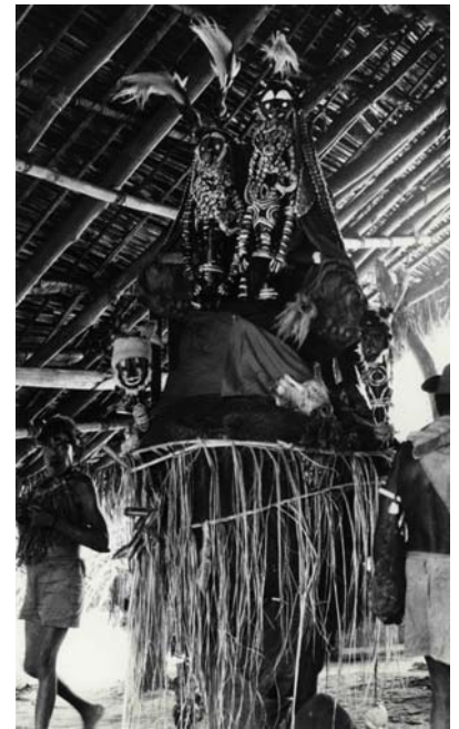
Fig. 11. Esposizione di due sculture nokwi rappresentanti una madre e una figlia, nel villaggio di Nageri. Foto di R. Bowden, 1973.

Legno, creta, peli umani, fibre vegetali, piume, cenere, calce e ocre policrome.