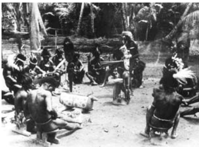
Fig. 5. Un teket al centro di un dibattito cerimoniale. Villaggio di Yentchen, 1953.