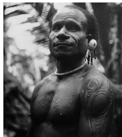
Fig. 6. Guerriero di Mindinbit con il petto e la spalla decorati da scarificazioni. Foto di J. Ratisbonne, 1935.