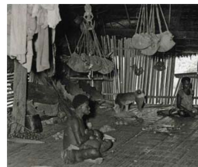
Fig. 8. Sacchi sospesi a ganci all'interno di una casa Iatmul del villaggio di Aibom, Medio Sepik.