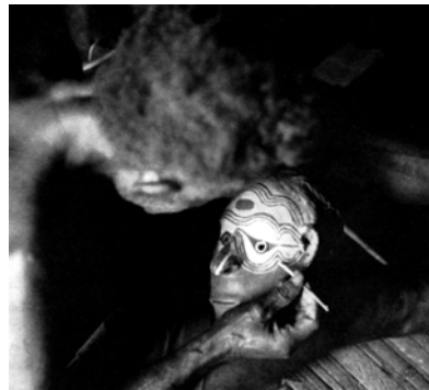
Fig. 10. Pittore del villaggio di Aibom (Medio Sepik) nell'atto di decorare un cranio rimodellato.

Cranio umano, capelli, argilla, mastice vegetale, calce, ocre e cipree.