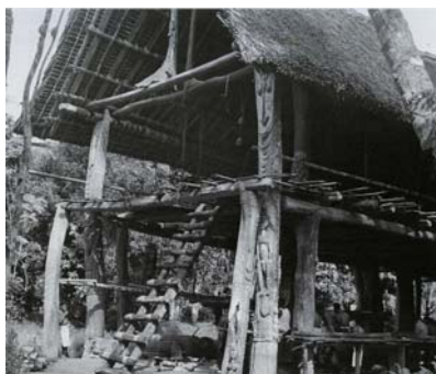
Fig. 4. Casa degli uomini di Kanganaman, Medio Sepik. Foto di M. Schuster, anni '60.